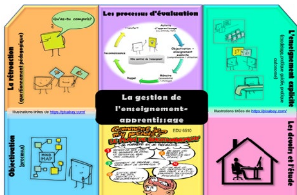
Fig. 1 - Schéma A — Stratégies de gestion de classe [cours EDU 6510]. Illustrations tirées de https://pixabay.com/ et EDU 6510

Quand on traite d'enseignement efficace, on aborde un ensemble d'interventions pédagogiques dont les effets probants sur l'apprentissage ont été testés et mesurés en classe. Dans le cours EDU 6510, l'enseignant a l'occasion de s'appropriier les éléments essentiels d'un ensemble de dix stratégies (quatre en gestion de classe : figure 1 ; six en gestion de l'enseignement-apprentissage : figure 2) ayant une influence positive sur l'apprentissage des élèves. Pour permettre une intégration de ces pratiques, les participants sont invités à expérimenter quelques-unes selon leurs besoins, en fonction de leur contexte professionnel. Selon cette analyse, ils pourront valider, bonifier, ajuster des pratiques déjà utilisées et ils pourront en expérimenter de nouvelles, et ce, directement en salle de classe.