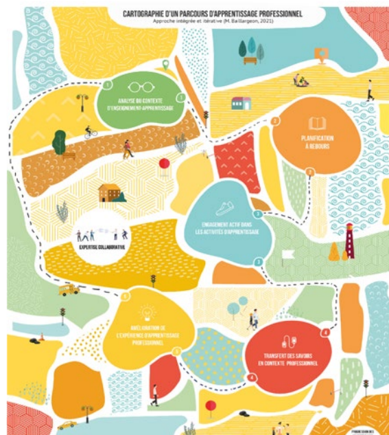
Cartographie d'un parcours d'apprentissage professionnel (Baillargeon, 2022)

Ce parcours est général et s'applique à toutes les activités de développement professionnel : ateliers de formation, cours universitaires, communauté de pratiques, etc. L'analogie de la cartographie permet d'illustrer qu'un parcours de développement professionnel n'est pas toujours fluide et clairement défini, et ce, même si la progression des apprentissages chez les élèves en représente la visée. Il s'agit d'un cheminement sinueux composé d'obstacles, de réalisations, de questionnements, de prises de conscience, de victoires, etc.