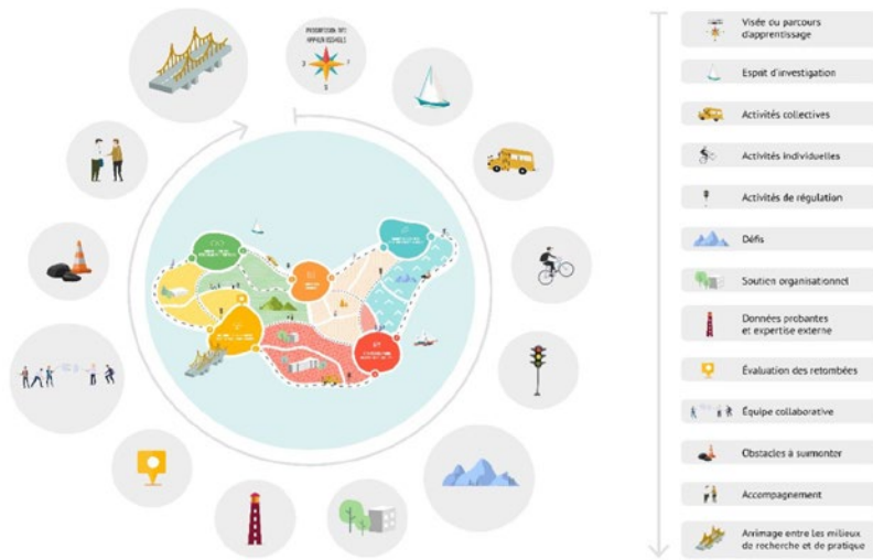
Légende et cartographie du cours Enseignement explicite : fondements et pratiques (Baillargeon, 2022)

Cette cartographie permet de visualiser la diversité des contextes (textures), les modalités de réalisation (solo, duo ou groupe), les obstacles (constructions, pierres, détours, barrières, etc.), la vitesse de réalisation (à pied, en vélo, etc.), les balises d'orientation (phare, feux de signalisation, lampadaires, drapeaux, etc.). Il suffit alors d'adapter la cartographie à un contexte spécifique d'apprentissage professionnel et d'y ajouter une légende. Voici un exemple créé pour le cours L'enseignement explicite (EDU 6511) de l'Université TÉLUQ.